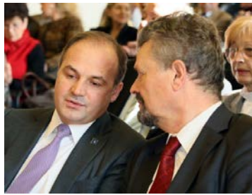
Dr. Enver Hoxhaj und Dr. h.c. Gernot Erler