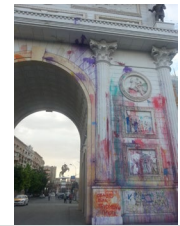
„Colorful revolution“ – Eindrücke aus Skopje – Juni 2016