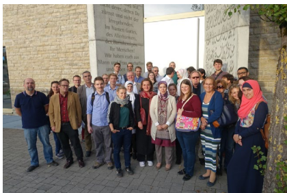
Exkursion nach Penzberg