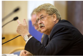
Internationale Konferenz: Gefahr an den Rändern Europas? Elmar Brok, MEP, Vorsitzender des Auswärtigen Ausschusses des Europaparlaments