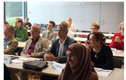
Teilnehmer/innen Hochschulwoche 2016