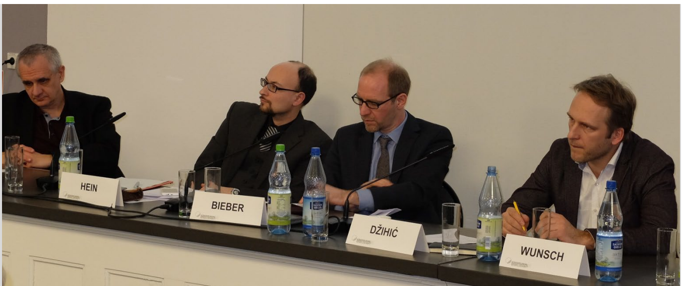
Symposium des Wissenschaftlichen Beirats 24. Februar 2017 in Halle – Krise der Demokratie in Südosteuropa: Ursachen und Auswege

Wir von der Geschäftsstelle können Sie nur ermuntern, diesen Service zu nutzen, und all diejenigen motivieren, die bisher ihr Profil noch nicht eingestellt haben, dies nachzuholen. Sie brauchen Ihren Benutzernamen und das Passwort, das Ihnen unsere Webadministration zugeschickt hatte und ein wenig Zeit, um Ihr Profil einzustellen (und freizuschalten!). Der Bereich ist, wie gesagt, nur für die SOG-Mitglieder zugänglich – und natürlich sind Teilnahme und Nutzung Ihnen überlassen und nicht verpflichtend.