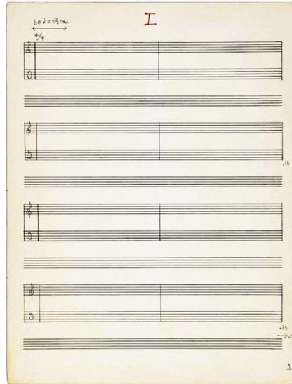
4'33", John Cage, for solo piano (1952) reconstruction by David Tudor, p. 1, ca 1989